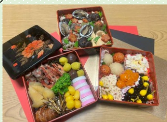
管理栄養士さん家のおせち