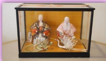
お雛さま (エントランス)