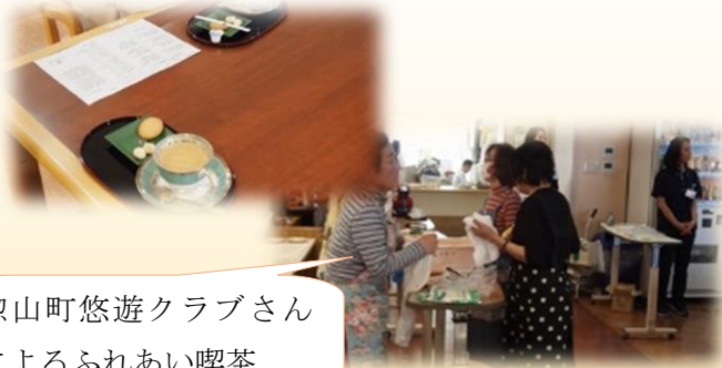
惣山町悠遊クラブさん によるふれあい喫茶