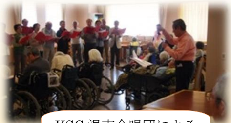
KSC 混声合唱団による コーラス演奏