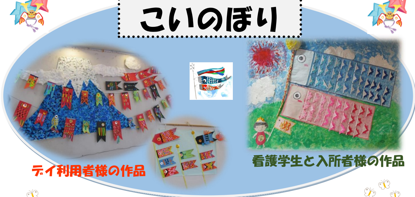
デイ利用者様の作品