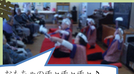
おもちゃのチャチャチャ♪