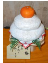
できあがった鏡餅

今回のもちつき大会は2階入所者3階入所者、デイケア利用者を対象に3回に分けてお餅つきを行いました。