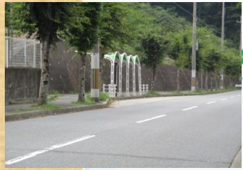
大原1丁目バス停付近