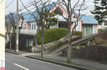
桂木集会所前付近