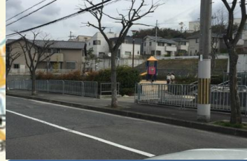
別当谷公園前付近